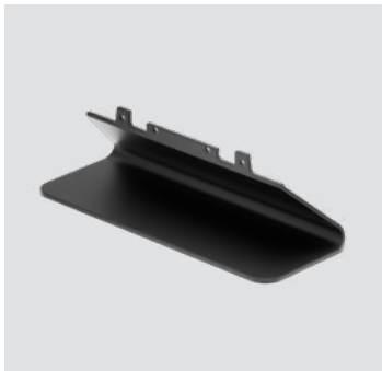
Vision 5 - TTM 01