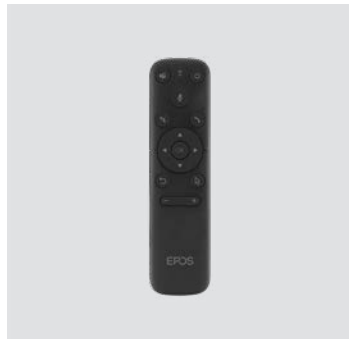
VISION - RC 01T