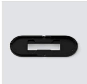
EXPAND 80 tafelbevestiging