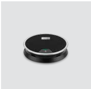
EXPAND 80 Mic