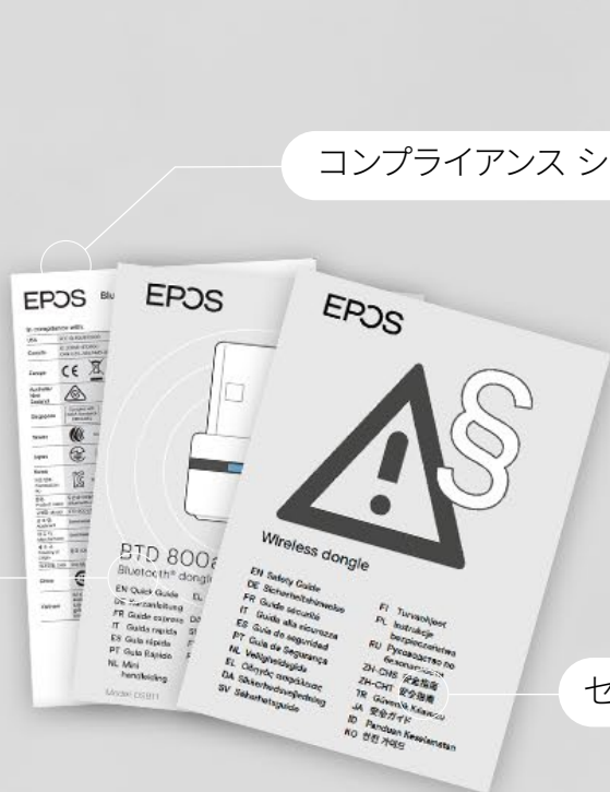
コンプライアンス シート