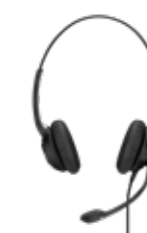
Série IMPACT 200