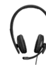
Série ADAPT 100