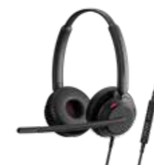
Série IMPACT 700